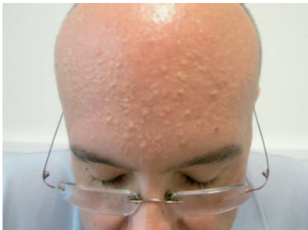
Figura 1. Fibromas perifoliculares frontales.