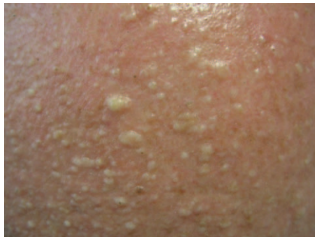
Figura 2. Detalle de las lesiones frontales mostradas en la figura 1.

el cuello y la región superior del tórax. El paciente no presentaba otras lesiones cutáneas ni mucosas.